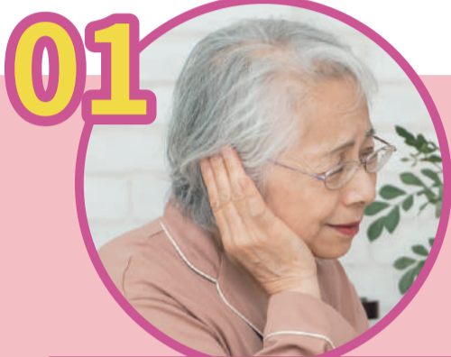
ピーピー雑音がする