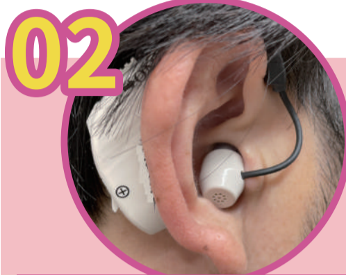
大きくて目立つからイヤ