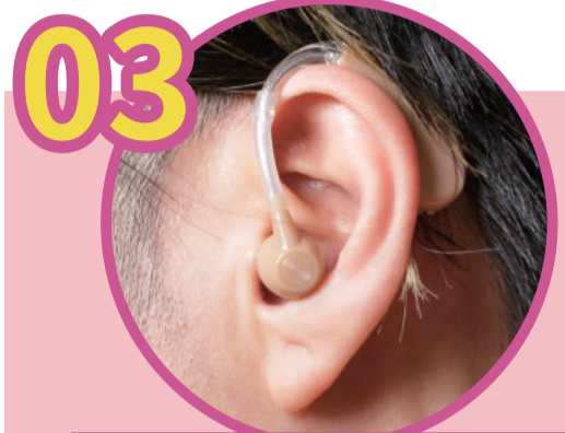
見た目がカッコ悪い